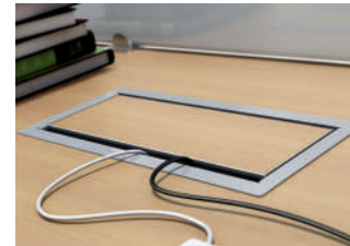
DE. Detailansicht der Box Plus Abdeckung.