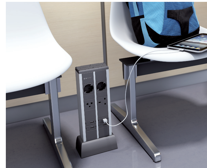
EN. Duplo Charge Point installed on a university.