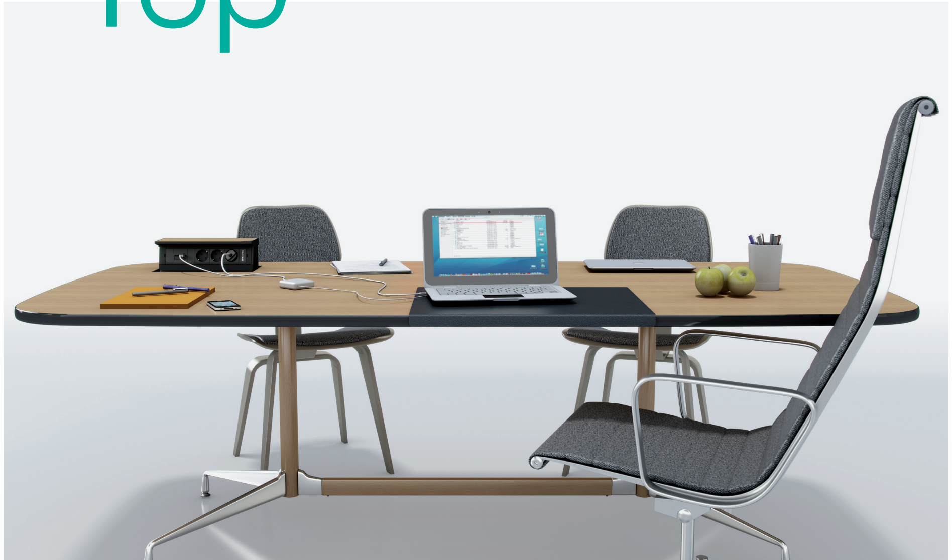
ES. Top instalada en mesa de dirección.