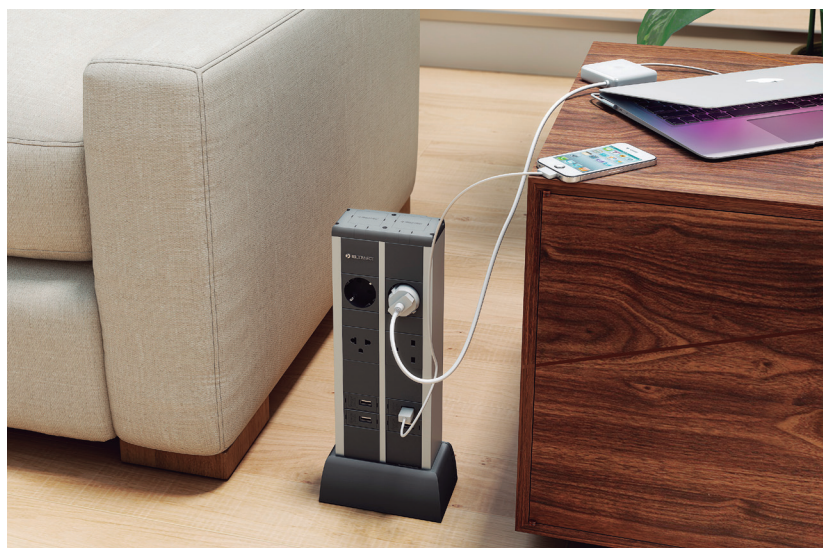
IT. Duplo Charge Point installata nella sala d'attesa di un hotel.