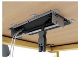
IT. Accesso alle connessioni.