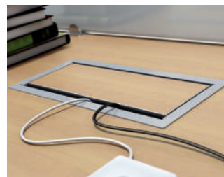
IT. Particolare della copertura della Box Plus.