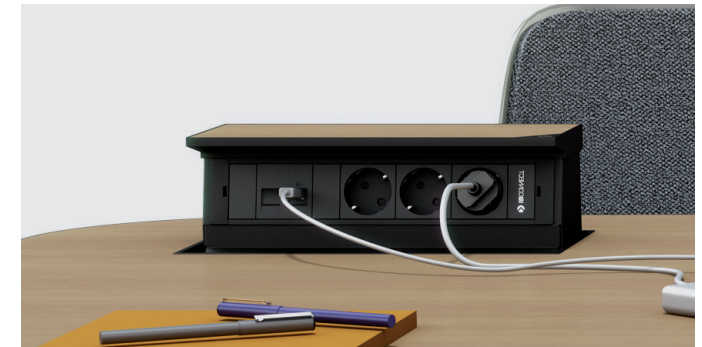
IT. Dettaglio della scatola Top chiusa e aperta.