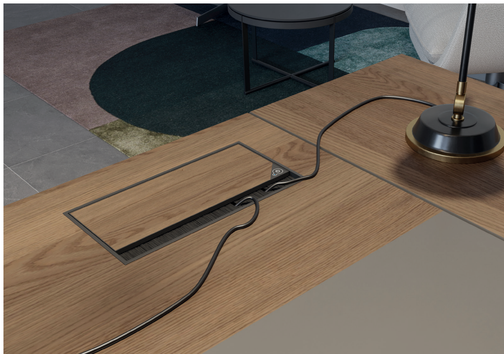
DE Ansicht vom Top geschlossen und geöffnet.