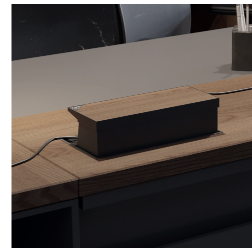
EN. Detail of closed and open Top.