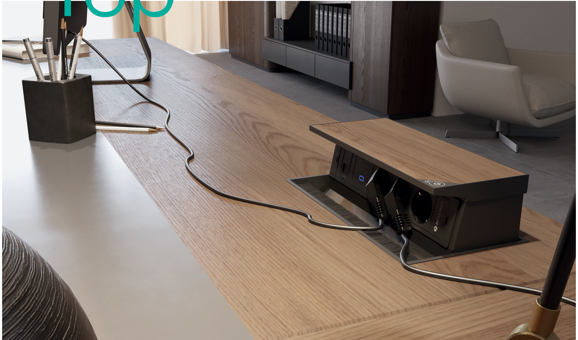
DE. Top installiert in einem Manage- mentbereich.